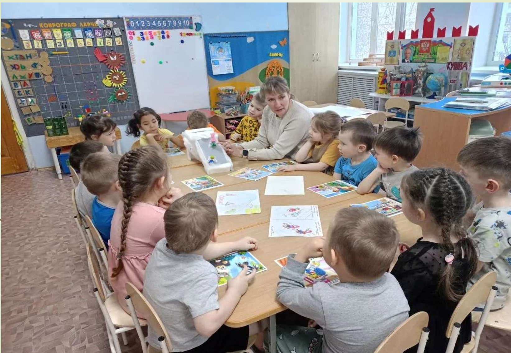
Беседа «Опасные ситуации в зимнее время»