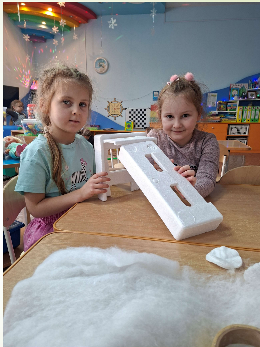
Создание макета «Горка»