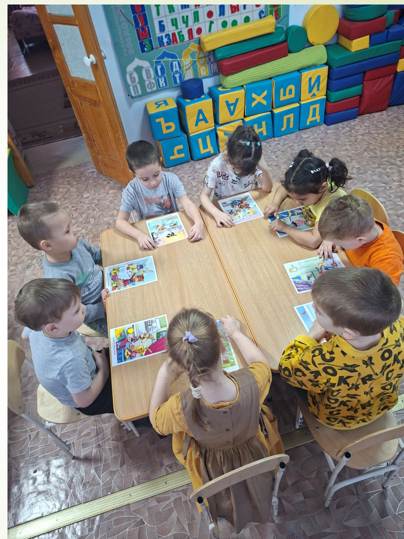
Рисунки «Безопасность зимой»