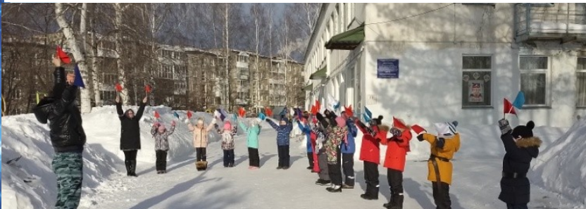
«Подать сигнал, используя семафорную азбуку»

Участники «Зарницы» проявили в ходе игры смелость, дружбу и взаимовыручку