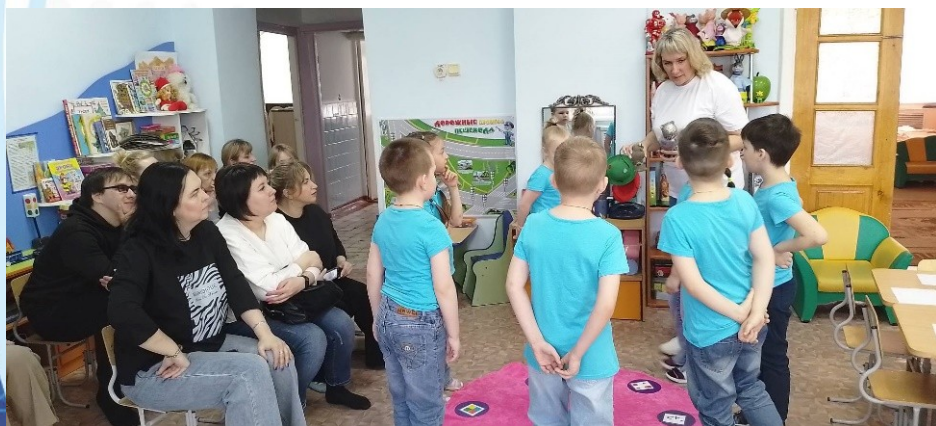
Интегрированное занятие в подготовительной к школе группе на тему «Свойства предметов» в форме игры «Что, где, когда?» (18.03.2024г.)