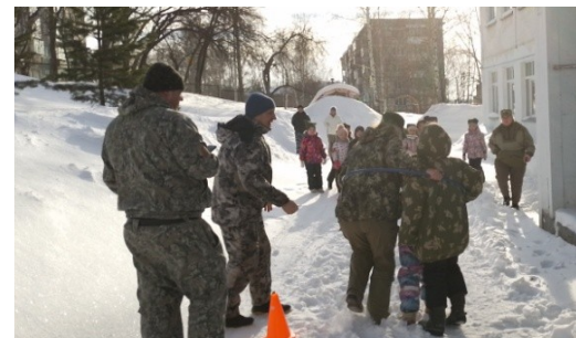
«Перебраться с помощью одной лодки на другой берег»