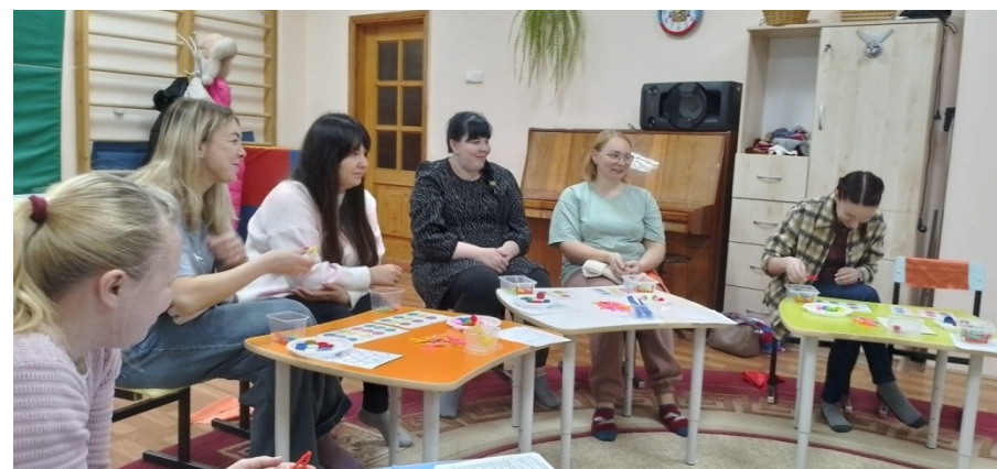
Семинар-практикум для родителей детей раннего возраста на тему «Игры на развитие мелкой моторики, пальчиковые игры в речевом развитии детей 2 – 3 лет» (10.12. 2024г.)