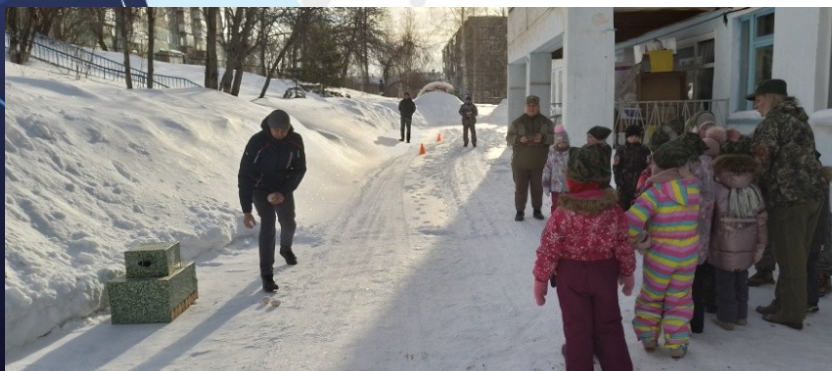
«Подбить вражеский танк»