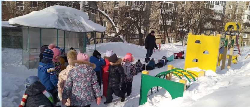
«Перебраться на другую сторону поля»

Участники: воспитанники подготовительных к школе групп (отряд «Пехотинцы», отряд «Патриоты»), папы и дедушки воспитанников, педагоги (35 детей, 12 взрослых)